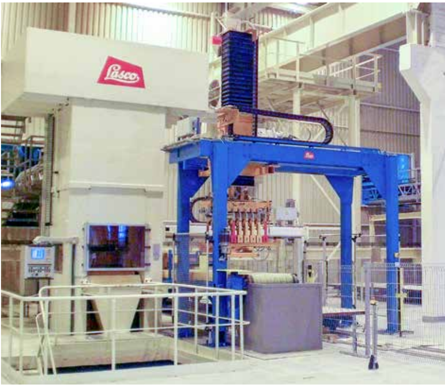
Современный пресс LASCО KSP 801 заменит старый механический пресс на предприятии AB Silikatas Akcine Bendrove в Вильнюсе.

© Текст и фото: Гейдельбергский силикатный кирпич GmbH