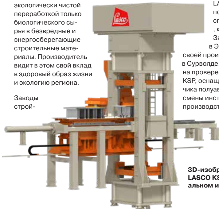
3D-изображение прессы LASCO KSP 850 в специальном исполнении

своей производственной площадки в Сурволде. Устройство, основанное на проверенной конструкции серии KSP, оснащено по желанию заказчика полуавтоматической системой смены инструмента и более высокой производственной мощностью.