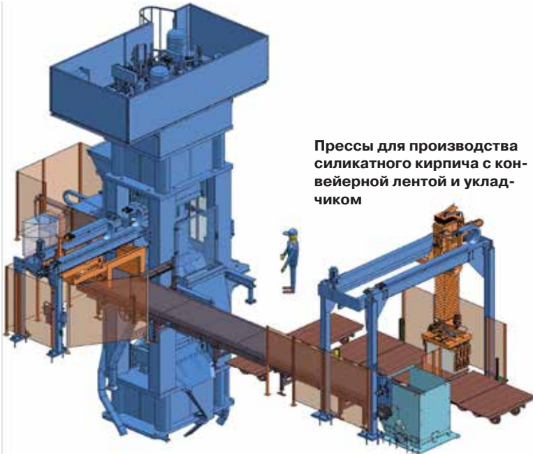
Прессы для производства силикатного кирпича с конвейерной лентой и укладчиком